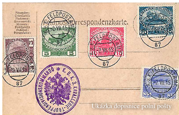
Ukázka dopisnice polní pošty

Výsledek války byl pro obyčejný lid stále v nedohlednu a nejistý. Postupně ale i do Nedvědice přicházely zprávy o postupném rozkladu německo - rakouské moci. Všichni si zde přáli, aby tento vývoj trval až do úplného zhroutilí ústředních států, zvláště obávaného Německa. Zprávy o zahraničním odboji Masarykově a jeho družiny byly velmi přísně zatajovány. Teprve projev českých spisovatelů v čele s Jiráskem a pak slavnostně pronesená přísaha našich poslanců přinesly nový osvěžující proud života, po letech obav a úzkostí si občané Nedvědice zhluboka vydech-