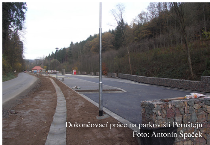
Dokončovací práce na parkovišti Pernštejn

Pracovníci obce kromě běžných úklidových a údržbářských prací provedli montáž veřejného osvětlení na Kovářově louce, zde také umístili dětskou skluzavku a připravili podklad pro montáž houpačky. Oba hrací prvky byly zakoupeny z dotace získané z rozpočtu Jihomoravského kraje. Díky dlouho příznivému počasí letošního podzimu se nám podařilo v areálu u rybníka položit zemní vedení elektrické energie, provést nejnnutnější opravy veřejného osvětlení vč. umístění dalších 9 ks LED světel na trase od kostela k Vejpušku, provést lokální opravy nejvíce poškozených místních komunikací a další. Dobrou zprávou je určitě dodavatelsky zrealizovaná oprava místní komunikace, tzv. panelovky.