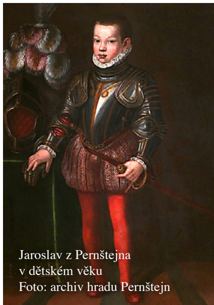
Jaroslav z Pernštejna v dětském věku