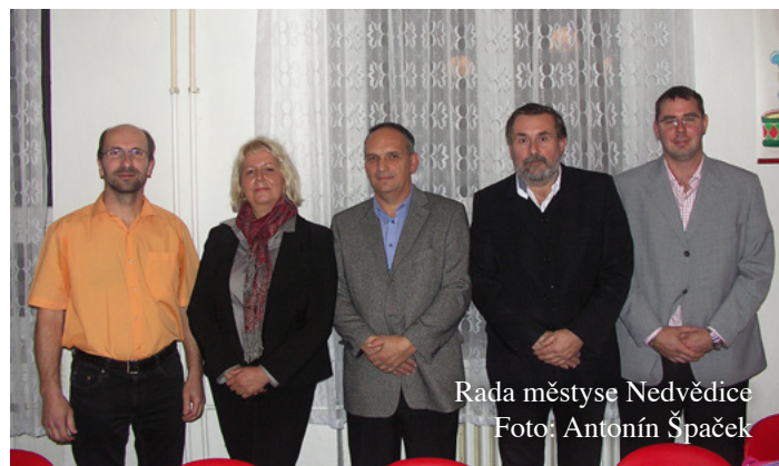
Rada městyse Nedvědice