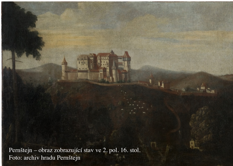
Pernštejn – obraz zobrazující stav ve 2. pol. 16. stol.

Jaroslav měl veškeré předpoklady k tomu, aby udělal zářivou kariéru. Prvorozený syn se skvělým původem, relativně bohatý, vzdělaný intelektuál své doby se zajímavými styky s italskými humanistickými kruhy patřil k nejoblíbenějším dvořanům krále Ferdinanda, kterému sloužil jako komorník. Jako nejstarší syn navenek reprezentoval rod a bohužel od samého počátku ne příliš šťastně. Mnoho dřívějších perňštejnských přívrženců pobouřila