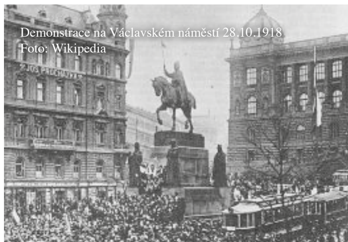
Demonstrace na Václavském náměstí 28.10.1918