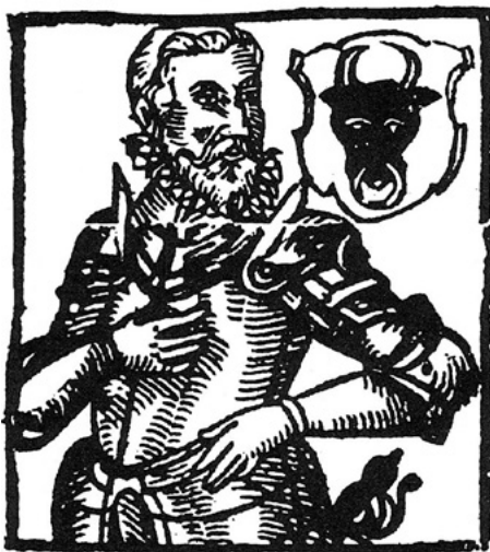
Jaroslav z Pernštejna dle Paprockého, dřevoryt

Vzniklou finanční aféru nakonec na přímluvu pana Vratislava vyřešil panovník. Koupil Pardubice, na kterých za Jaroslavova života sám rád pobýval a které byly velmi reprezentativním sídlem a velkým a výnosným panstvím pro následníka trůnu arciknížete Maxmiliána, a zavázal se uhradit Jaroslavovy dluhy. Tato aféra velmi poškodila prestiž Pernštejnů a sám Jaroslav, který dříve proslul jako mimořádně vzdělaný aristokrat, štědrý mecenáš a podporovatel renesančního umění a literatury, za ni zaplatil životem a pověstí hýřilce a marnotratníka.