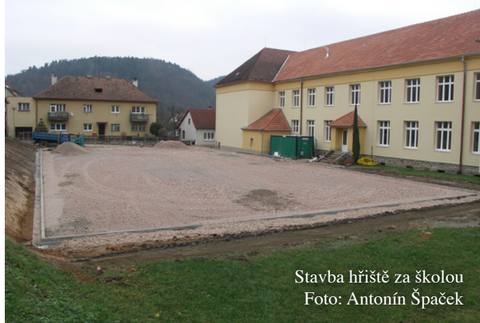
Stavba hřiště za školou

Závěr roku je vždy obdobím bilancování a je také vhodnou příležitostí k poděkování. Chtěl bych v tuto chvíli poděkovat všem