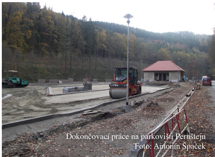
Dokončovací práce na parkovišti Pernštejn

více, náročnost se po všech stránkách násobí. Přesto především díky pečlivé práci osob odpovědných za jednotlivé projekty a také díky nabytým zkušenostem z projektů, které jsme již zdárně ukončili, procházejí všechny tři úspěšně jednotlivými etapami realizace. Parkoviště pro návštěvníky hradu Pernštejna se nyní v polovině listopadu začíná rýsovat v jeho konečné podobě – dokončuje se stavba povrchů, probíhají práce na obslužném objektu, v zadní části staveniště firma již provádí konečné terénní úpravy a všichni věříme, že nás počasí nechá ještě pár týdnů pracovat. Radost nám zde však kazí opakující se krádeže stavebního materiálu, a to i již pevně zabudovaného v jednotlivých částech stavby.