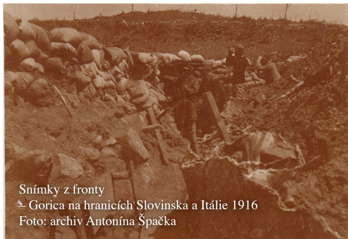
Snímky z fronty ↳ Gorica na hranicích Slovinska a Itálie 1916

Pokračujeme druhou částí vzpomínek na Velkou válku 1914 - 1918 podle záznamů zdejšího kronikáře Jana Rosího, který využil podkladů a poznámek svého kronikářského předchůdce Josefa Skoumala.