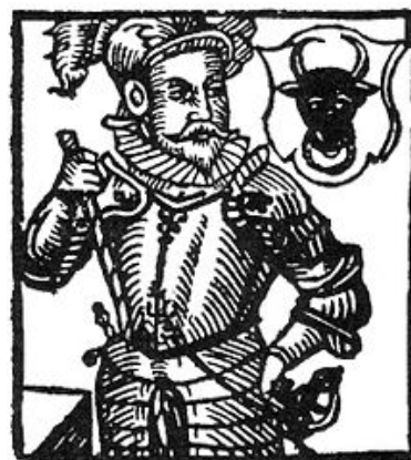
Vojtěch z Pernštejna dle Paprockého, dřevoryt