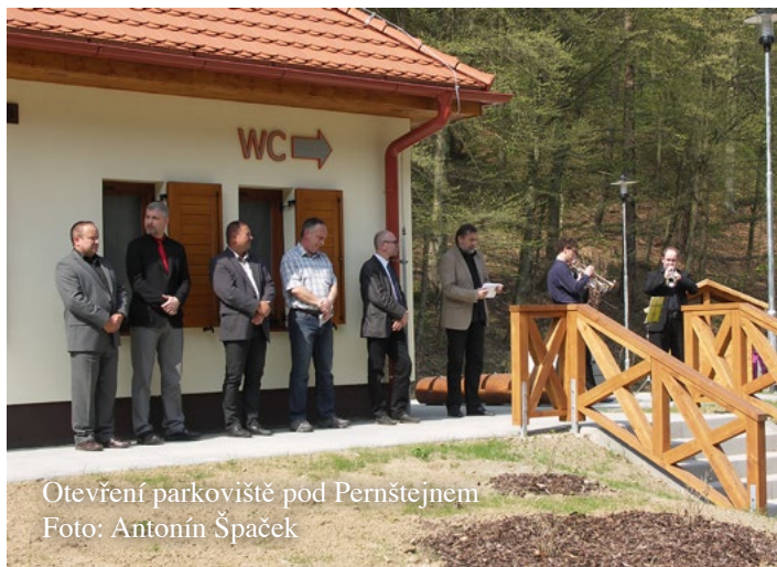
Otevření parkoviště pod Pernštejnem

kde hlasitost hudby i vlastního hlášení trhala uši. Naopak snížení kvality poslechu se projevilo v určité vzdálenosti od radnice, kde dosud bylo hlášení slyšitelné „tak akorát“ a nyní si tam občané budou muset vyzorovat místo, kde budou mít nejlepší slyšitelnost. Jistě nezanedbatelnou součástí tohoto projektu je nová moderní ústředna, hladinoměr na Nedvědičce a srážkoměr na budově C základní školy. Obě zařízení provádějí nepřetržitě měření výšky hladiny, resp. množství srážek a údaje jsou on line dostupné na www.edpp.cz . Na této adrese jsou mj. dostupné i aktuální informace o výšce hladiny řeky Svratky v Ujčově, což je v případě vzniku povodňového nebezpečí pro Nedvědici velmi důležité.