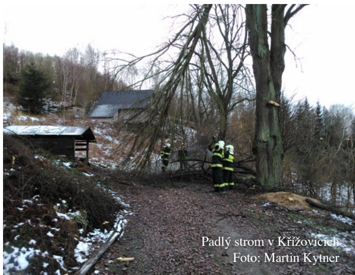
Padlý strom v Křížovicích

V neděli 24. května 2015 se uskutečnila v Dolním Čepí okrsková soutěž v požárním útoku a štafetě. Hasiči z Nedvědice se zúčastnili s jedním družstvem žen, dvěma družstvy mužů a dvěma družstvy dětí. Z celkového počtu 23 družstev obsadili muži 7. a 12. místo. Dětská družstva obsadila 4. a 5. místo. Čest nedvědických hasičů zachránily ženy, které ve své kategorii zvítězily.