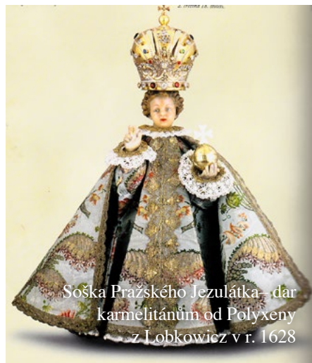
Soška Pražského Jezulátka – dar karmelitánům od Polyxeny z Lobkovic v r. 1628

boký citový vztah, bylo dlouho bezdětné. V roce 1608 se narodil vytožený dědic Václav Eusebius, který se stal prapředkem všech pozdějších větví Lobkoviců. Narození syna znamenalo v životě paní Polyxeny zásadní životní předěl. Najednou už bylo pro koho hromadit dědictví a ona začala hospodařit, kupovat, prodávat. Ze-