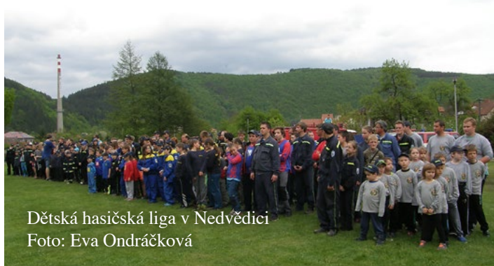
Dětská hasičská liga v Nedvědici

V úterý 31. března 2015 v 17.51 hodin vyjela jednotka SDH Nedvědice společně s profesionální jednotkou Hasičského záchranného sboru Tišnov k technické pomoci v podobě odklizení části stromu padlého na komunikaci v obci Křížovice. Po rozřezání a odklizení stromu z vozovky se jednotka vrátila po 20. hodině na základnu. Zásahu se zúčastnilo osm členů zásahové jednotky SDH Nedvědice.