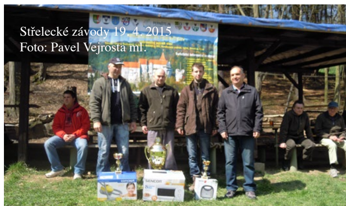
Střelecké závody 19. 4. 2015