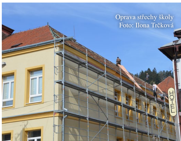
Oprava střechy školy

v okolí kontejnerů děje. Věřte, že je velmi deprimující vidět, jak se někteří naši spoluobčané chovají, když se domnívají, že jsou nepozorováni, a v jakých časech a jakým způsobem se odpadků dokážou zbavovat provozovatelé některých restauračních zařízení. Myslím, že nastává čas, abychom si sami mezi sebou udělali pořádek, pokud na popsané jevy nechceme doplácet všichni, tedy i ti, kteří nejen poctivě třídíme odpady, ale také se dlouhodobě snažíme dodržovat obecná pravidla, zákony a vyhlášky.