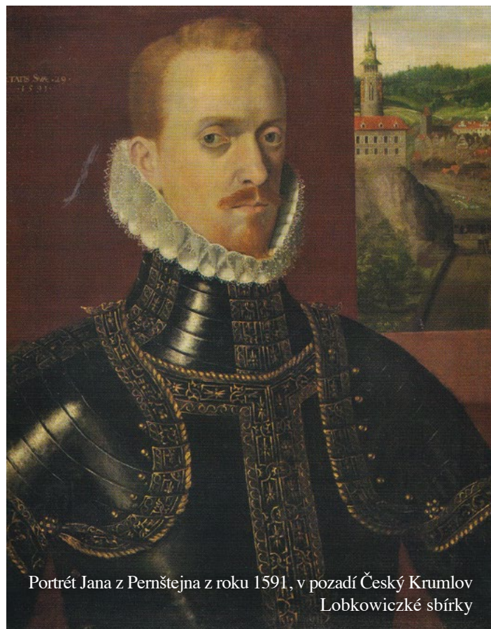
Portrét Jana z Pernštejna z roku 1591, v pozadí Český Krumlov

Pernštejský rod tak na řadu let zůstal bez dospělého mužského představitele. Přesto se perněštejská rodina těšila u pražského rudolfínského dvora značné pozornosti a mimořádnému významu. Důvodem byla dlouhodobá španělská kulturně-politická orientace rodiny a „perněštejský salon“, který již za života svého muže vytvořila a pak udržovala Vratislavova žena Marie Pernštejská de Lara. Pernštejský dům na Hradčanech se stal