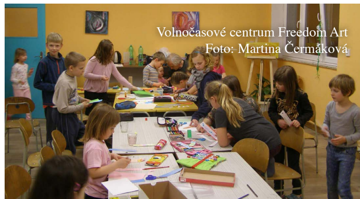
Volnočasové centrum Freedom Art

Ani o prázdninách se v centru nezahálelo. Na začátku čer-