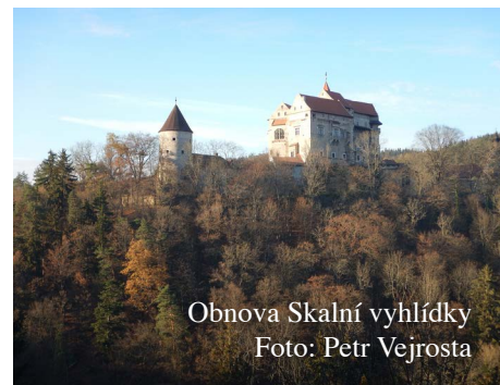
Obnova Skalní vyhlídky