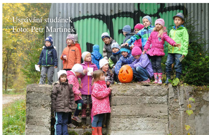
Uspávání studánek

U studánky stojíme, copak my jí povíme? O čistotu její vody někdy dost se bojíme. Přejeme ti, studánko, stále čistou vodu, ať ti nikdo neublíží, nezpůsobí škodu.