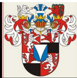
Erb Lichtenštejnů - Kastelkornů