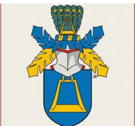
Erb Licků z Rýzmburka