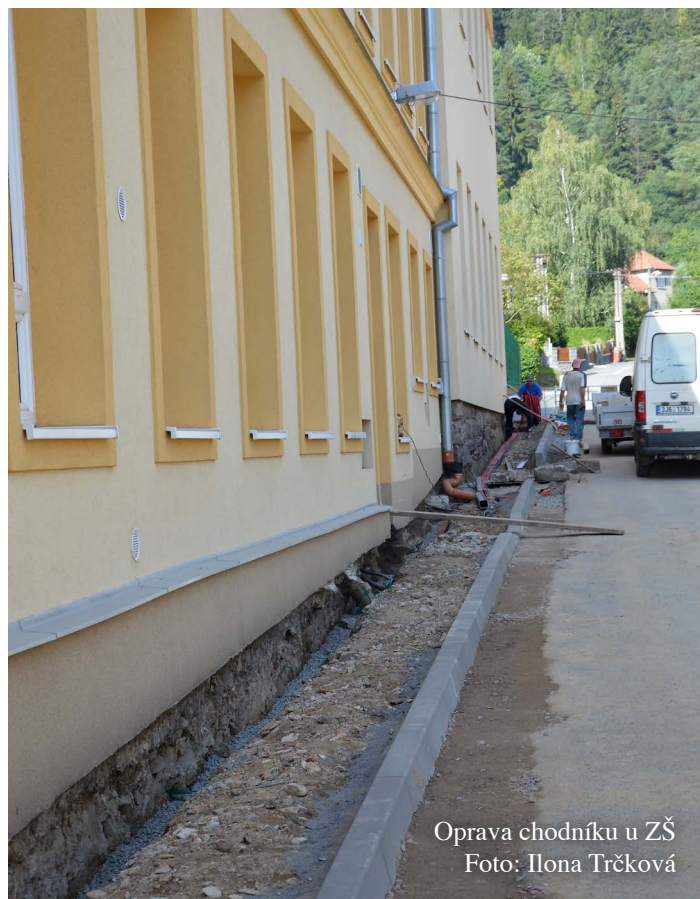
Oprava chodníku u ZŠ

Značné úsilí jsme v průběhu podzimních měsíců věnovali přípravě rozpočtu na rok 2016. Jako vždy i letos byla jednání složitá. Potřeb je mnoho, financí už méně a názory jednotlivých zastupitelů na to, co je prioritní, se také často velmi rozcházejí. Přes výše uvedené myslím, že se stejně jako v letech minulých podařilo připravit rozpočet vyvážený, pamatující jak na běžné provozní potřeby, tak i na investice do majetku městyse, a především opět rozpočet vyrovnaný. K rozpočtu ještě dvě poznámky. Tak především je třeba, abychom se všichni připravili na skutečnost, že skončilo období štědrých dotací a že mnohamilionové dotace na velké projekty jsou pro český a moravský venkov minimálně do roku 2020 minulostí. Ptáte se, jak je to možné? Odpověď je velmi jednoduchá. Naši politici a vládní úředníci totiž vyjednali pro dotační období 2014 - 2020 zcela odlišnou strukturu dotačních programů oproti období 2007 - 2013. Vyjednali ji pod silným tlakem představitelů a politiků z velkých měst a tato nová struktura operačních programů zabezpečí pro vybrané metropole a jejich bezprostřední spádová území čerpat převážnou část alokovaných dotací z EU na úkor venkovského prostředí. Druhá poznámka se týká tzv. rozpočtového určení daní (RUD), tedy instrumentu, kterým jsou