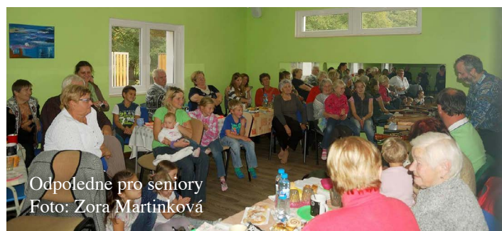
Odpoledne pro seniory

Tak zněl název akce, kterou se v neděli 11. října 2015 zapojilo nedvědicke volnočasové centrum Freedom Art do celostátního projektu 72 hodin. Náplní tohoto projektu jsou tři dny plné dobrovolnických aktivit směřované na určitou skupinu lidí,