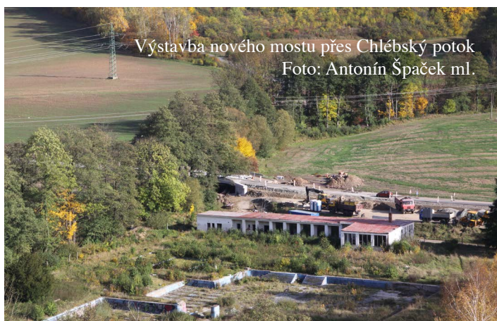
Výstavba nového mostu přes Chlébský potok

Právě skončená letní turistická sezona opět přinesla bezpočet situací, kdy obsluha infocentra, obsluha nového parkoviště pod Pernštejnem, zaměstnanci radnice a možná i mnozí další byli konfrontováni se situací, kdy jsme většinou neúspěšně vysvětlovali našim návštěvníkům důvody, proč v Nedvědicích nemáme bankomat. Především zahraniční turisté jen nechápavě kroutí hlavou, protože je žádné vysvětlování nezajímá. Zajisté i mezi Vámi místními je mnoho těch, kteří byste existenci bankomatu v našem městečku uvítali. Ani mně tento absurdní stav není lhostejný. Ti z Vás, se kterými o situaci poměrně často diskutuji ve snaze hledat způsob jak pro Nedvědicí bankomat získat, situaci a důvody znají. Pro