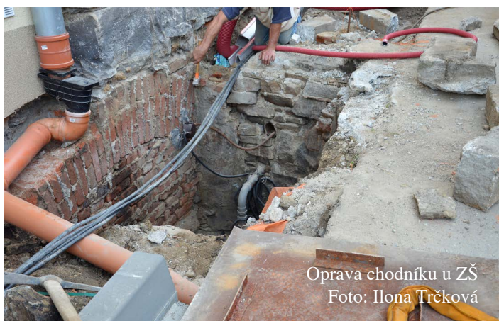
Oprava chodníku u ZŠ

Krátkou a bohužel již tradiční zmínku zaslouží také situace s odpady. Již několikrát jsem se v minulých číslech snažil vysvětlit a také apelovat na všechny, kteří jsou původci odpadů, aby se zaměřili na jejich důsledné třídění. Bohužel určitá část našich spoluobčanů a bezpochyby také část chatářů a někteří provozovatelé restauračních zařízení potřebu třídění odpadů zcela ignorují, čímž mj. „úspěšně“ vytvářejí podmínky pro nutné zdražení poplatků „za popelnice“ pro rok 2017. Bohužel na chování menšiny tak opět doplácí slušná většina občanů, která se snaží respektovat nastavená pravidla. Poslední poměrně masivní zkušenost je z konce října, mj. necelý týden po městysem organizovaném a financovaném sběru nebezpečného a velkoobjemového odpadu. I přesto, že tento sběr byl umožněn úplně všem našim občanům i chatářům, městys nabízel dokonce i odvoz z domácností ke kontejneru ve dvoře radnice, tak hned po víkendu se na dvou místech objevilo v kontejnerech i mimo ně velké množství neroztříděného odpadu,