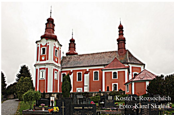
Kostel v Rozsochách

Arnošt Matyáš Mitrovský založil v roce 1734 nedaleko Míchova dvě nové vesnice. Byly nazvané podle názvu panství Ro-