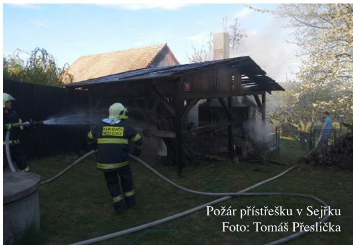
Požár přístřešku v Sejřku

Ve středu 20. března 2019 jsme byli vysláni na hrad Pernštejn, kde byl pomocí elektrické požární signalizace (EPS) detekován požár. Po příjezdu na místo jsme zjistili, že došlo k poruše na EPS, a tak byl náš výjezd naštěstí planý. Ve čtvrtek 11. dubna jsme vyjeli k dopravní nehodě na konci Nedvědice směrem k Ujčovu. Osobní automobil tam sjel z neznámých důvodů do řeky. Přes veškerou snahu nejen zasahujících hasičů a záchranářů, ale i některých místních občanů se nepodařilo zachránit 2 osoby a nehoda bohužel skončila tragicky. V sobotu 20. dubna jsme zasahovali u požáru přístřešku u rodinného domu v Sejřku. Díky rychlému zásahu i místní jednotky SDH Sejřek se požár nestačil rozšířit na obytný dům. Následující den v neděli chvíli před polednem jsme vyjeli k dalšímu požáru, tentokrát lesa u obce Věžná. Z důvodu rozsahu požáru a špatné dostupnosti hasební vody zásah trval asi 6 hodin. U posledních dvou výjezdů k požáru lesa (8. května na Kovářově a 23. května v Ujčově) se jednalo o planý poplach – nahlášené pálení.