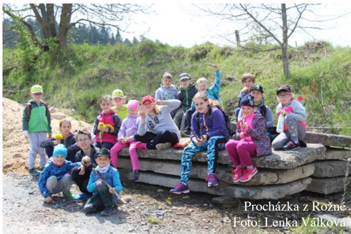
Procházka z Rožné

8. května 2019 se uskutečnila jedna z dalších společných akcí dětí a rodičů 4. třídy. Vlakem jsme odjeli do Rožné. Odtud jsme se vypravili po žluté turistické značce směrem k Nedvědicí. Čekala nás túra dlouhá necelých 10 km. Vedla nás nádhernou jarní přírodou přes Suché louky, Věžnou, Smrček a po naučné stezce na Vrbovou a Žlebem do Nedvědice. Během cesty jsme využili zkušenosti a znalosti našich mladých zálesáků, kteří se postarali o oheň a tím i o teplý oběd v podobě špekáčků. Se sluncem nad hlavou a větrem v zádech jsme si užili pěkný sváteční den.