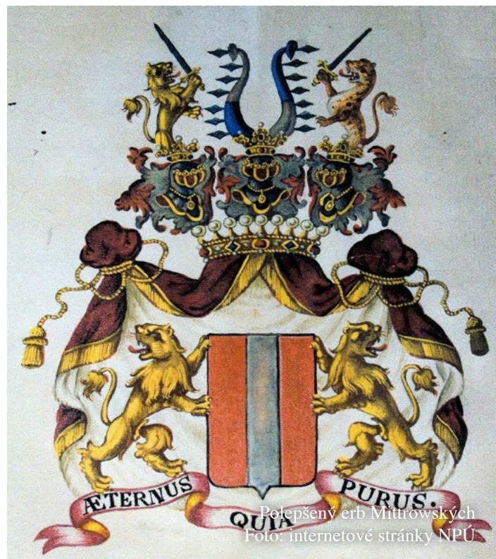
Polepšený erb Mitrowských

noven jihlavským krajským hejtmanem, 1797 přeložen ve stejné funkci do Znojma, 1799 vídeňský městský hejtman, 1801 dvorní rada nově zřízeného dvorního policejního úřadu, 1802 viceprezident dolnorakouské zemské vlády a tajný rada, 1804 viceprezident