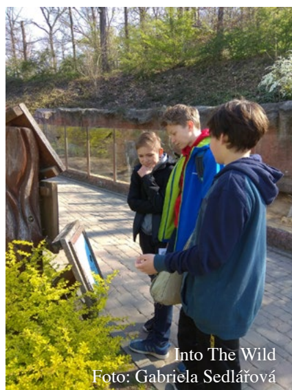
Into The Wild

V úterý 16. dubna se v brněnské ZOO uskutečnil další ročník atraktivní soutěže v anglickém jazyce s názvem INTO THE WILD.