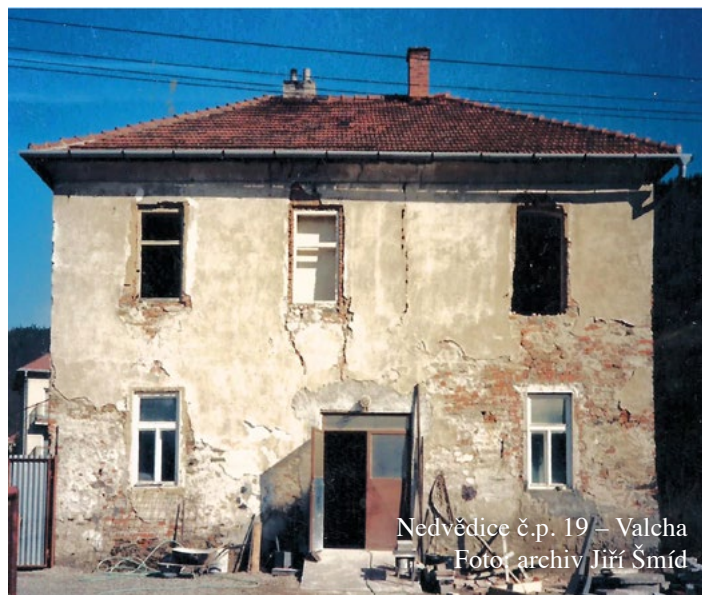
Nedvědice č.p. 19 – Valcha

V literatuře se uvádí, že v roce 1627 za panování Estery Žejdlické ze Šenfeldu a Kryštofa Pavla z Lichtenštejna - Kastelkornu na hradě Pernštejně byla u Klečan postavena valcha, z níž šel vrchnosti plat 6 gr. 1 d. za postavu sukna 1 .