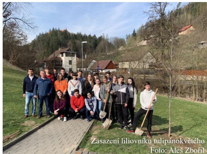
Zasazení liliovníku tulipánokvětého

Třídění odpadu by mělo být samozřejmostí, jak bylo zmíněno v úvodníku minulého Zpravodaje. Důvodem je stále rostou-