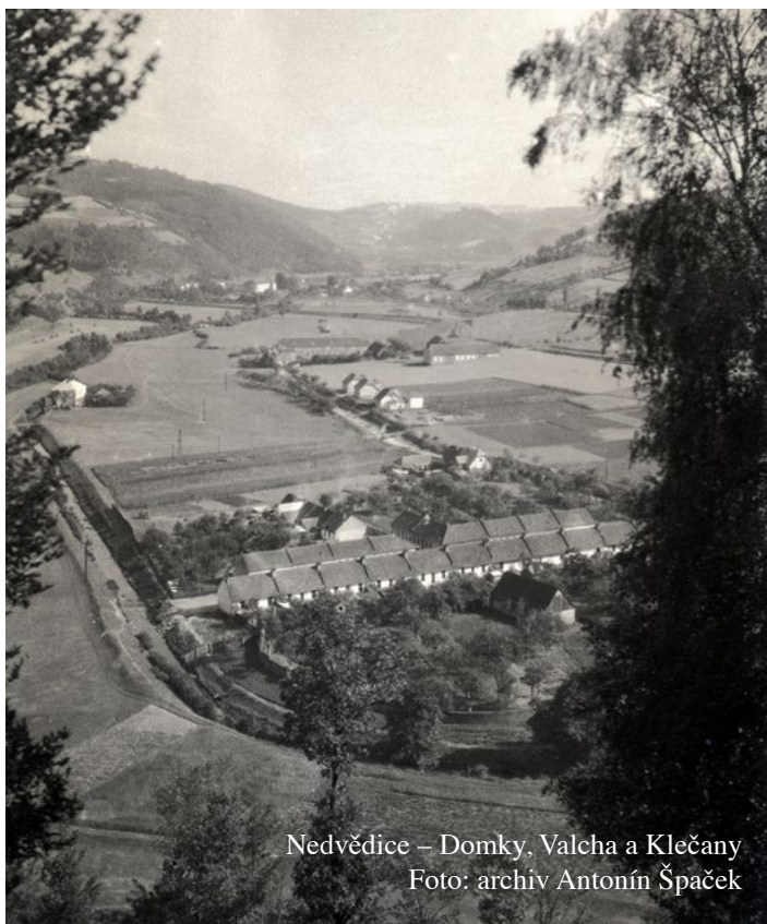
Nedvědice – Domky, Valcha a Klečany

Valcha byla provozovna na zplst'ování sukna. Valchováním se docílovalo homogenní struktury a současně docházelo k odmašťování a vypírání nečistot, které surové sukno obsahovalo. Princip valchování spočíval v tom, že se sukno trvale máčelo v horké vodě s přísádkem dobytčí moči (v minulosti jediného dostupného odmašťovacího prostředku) a současně mechanicky tlouklo. Palice řečené stupy byly upevněny na pákách zvaných biče, které se kývaly v loži zvaném káčer a tloukly do huňku (prohlubně) ve vydlabané kládě. Pohon stup zajišťovalo vodní kolo. Byly nadhazovány prostřednictvím kolíků zvaných kříže, které byly zaraženy ve valu (hřídeli kola). Voda z náhonu se vedla korýtka do velkého otevřeného kotle, kde se ohřívala, doplňovala močí a přepadem odváděla jiným korýtkem přímo pod stupy valchovacího zařízení. Tomuto vodnímu hospodářství valchaři přezdívali vasrkumšt. Balík tkaniny zvaný podstav se musel pod ranami stup pootáčet. Obsluha valchy vyžadovala soustředění obsluhujícího pracovníka.