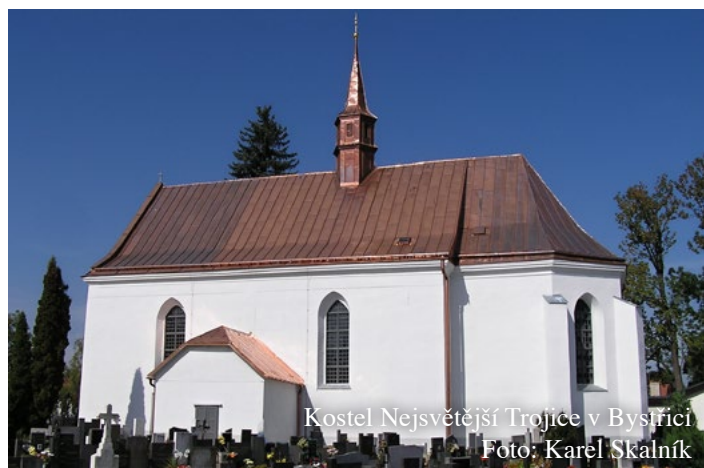
Kostel Nejsvětější Trojice v Bystřici

Hřbitovní kostel v Bystřici, nyní zasvěcený Nejsvětější Trojici, nechal vystavět v letech 1614 - 1615 majitel panství Jan Čejka z Olbramovic pro evangelíky. Zúčastnil se však stavovského povstání proti císaři Ferdinandu II., které skončilo v roce 1620 prohrou stavů, a jeho majetek propadl císaři. Kostel přestal sloužit