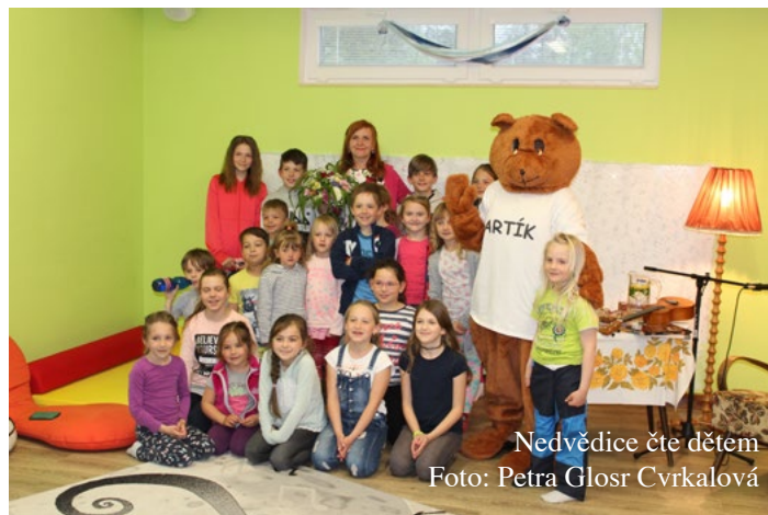
Nedvědice čte dětem

Vedle akcí pravidelných pořádáme během roku i několik jednorázových. Jejich nejpodstatnějším rysem je myšlenka společného trávení volného času dětí i dospělých. Prioritou centra rozhodně není „zabavit“ děti bez nějaké hlubší myšlenky. Velmi