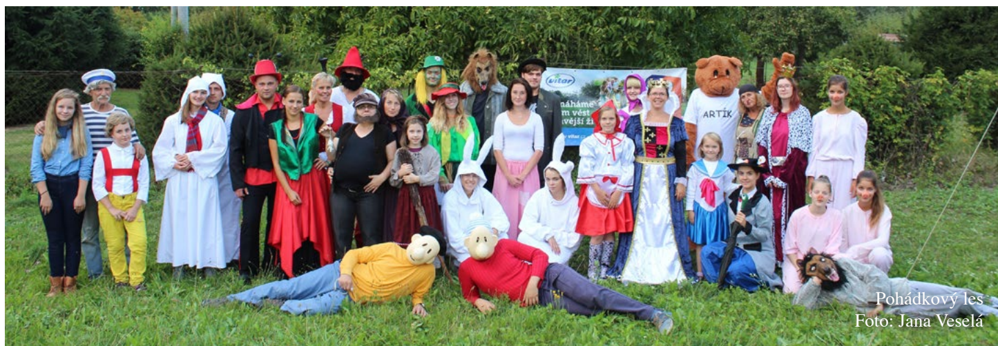
Pohádkový les

dobře si uvědomujeme, že společné zážitky dětem a rodičům nikdo nikdy nevezme, a proto se snažíme všechny naše akce koncipovat tak, aby si je užili dospělí i děti společně. V rámci těchto jed-