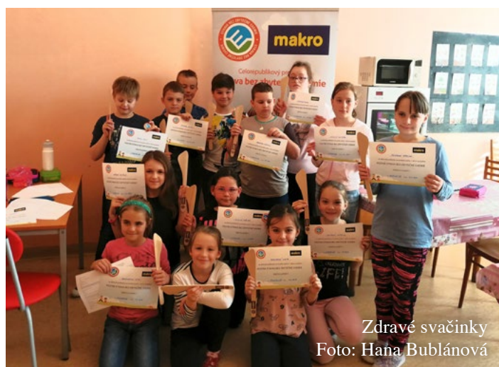
Zdravé svačinky