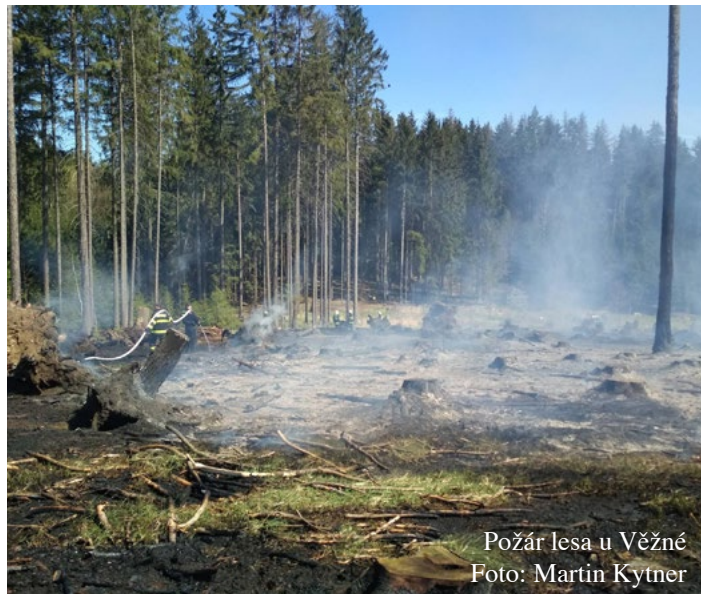
Požár lesa u Věžné

V souvislosti s planými výjezdy upozorňujeme občany na možnost ohlášení pálení Hasičskému záchrannému sboru kraje. V případě, že se chystáte pálit větvě, klestí apod., vyplňte formulář na těchto webových stránkách: https://paleni.izscr.cz/ . Odesláním vyplněného formuláře se dostanete do evidence „Operačního a in-