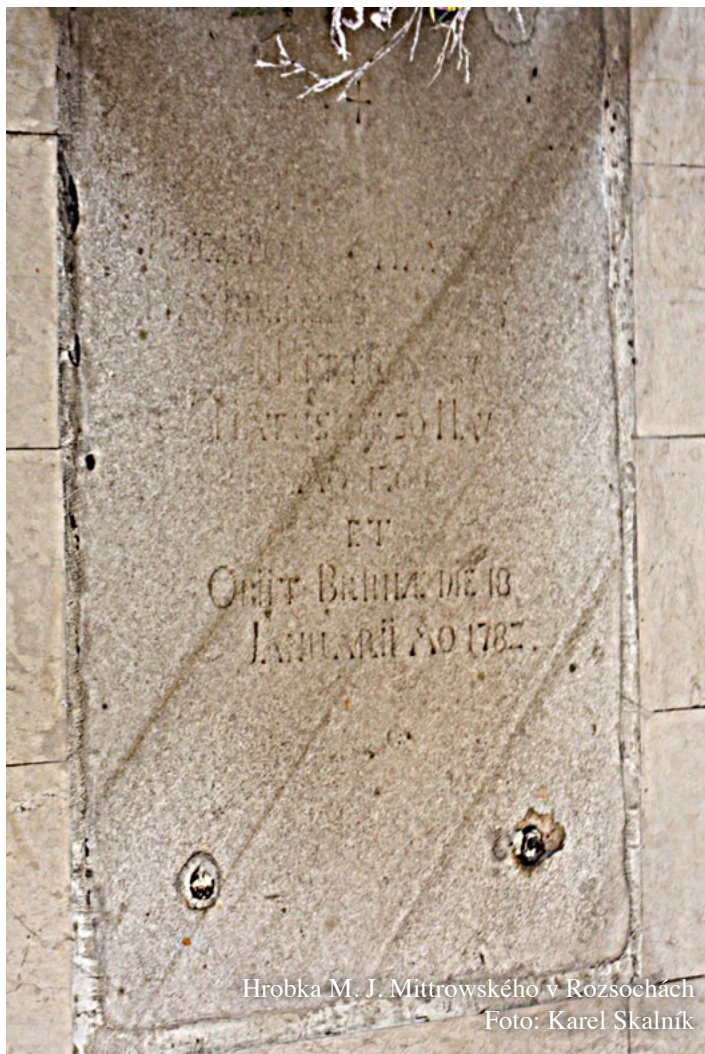
Hrobka M. J. Mittrowského v Rozsochách

postrkané sedmi stříbrnými hroty kopí, z pravé roste zlatý lev, z levé tygr přirozené barvy, oba drží v pravých tlapách pozdvižený meč se zlatou rukojetí. Příkrývadla červenostříbrná. Štítonoši dva zlatí odvrácení lvi.