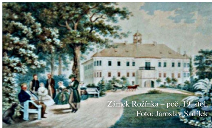
Zámek Rožínka – poč. 19. stol.

V Rozsochách nechal v letech 1763 - 1766 přestavět kostel svatého Bartoloměje, který byl v havarijním stavu. Pod presbytářem kostela si nechal zřídit hrobku, kde byl v roce 1782 pochován. Na mramorovém kameni, který uzavírá vstup do hrobky je latinský nápis, který v překladu sděluje že „zde leží největší z