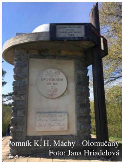
Pomník K. H. Máchy - Olomučany