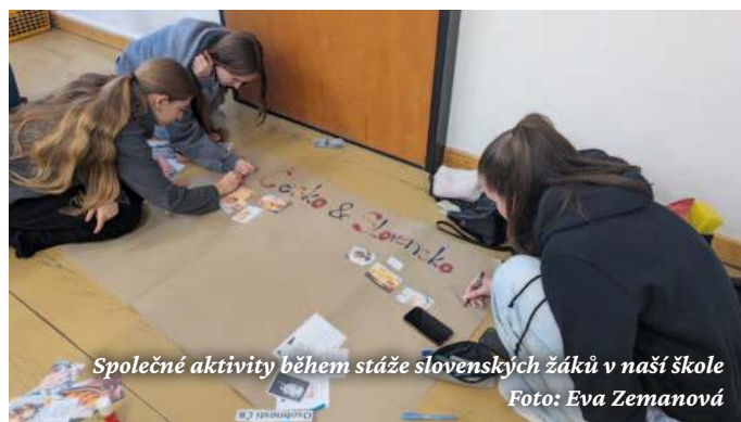
Společné aktivity během stáže slovenských žáků v naší škole