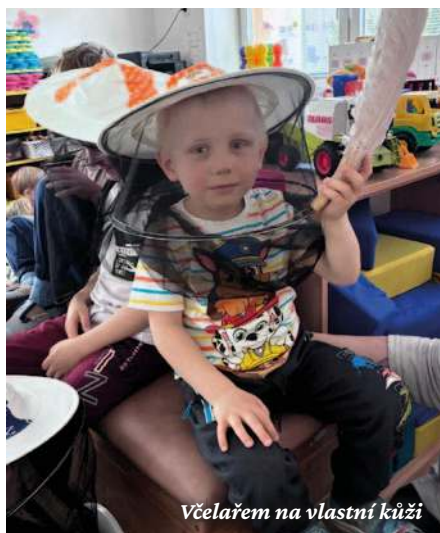
Včelařem na vlastní kůži