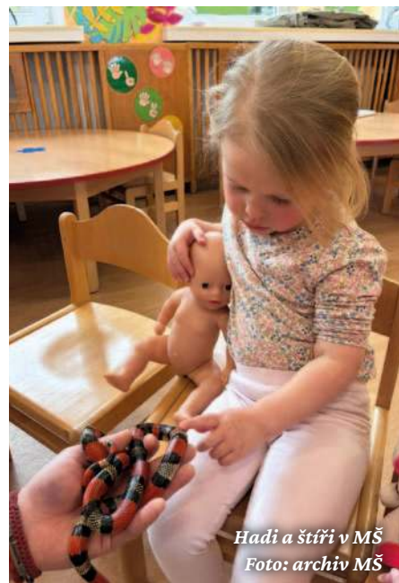
Hadi a štíři v MŠ