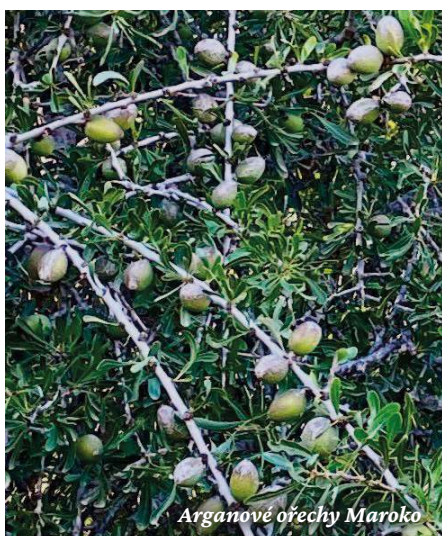
Arganové ořechy Maroko