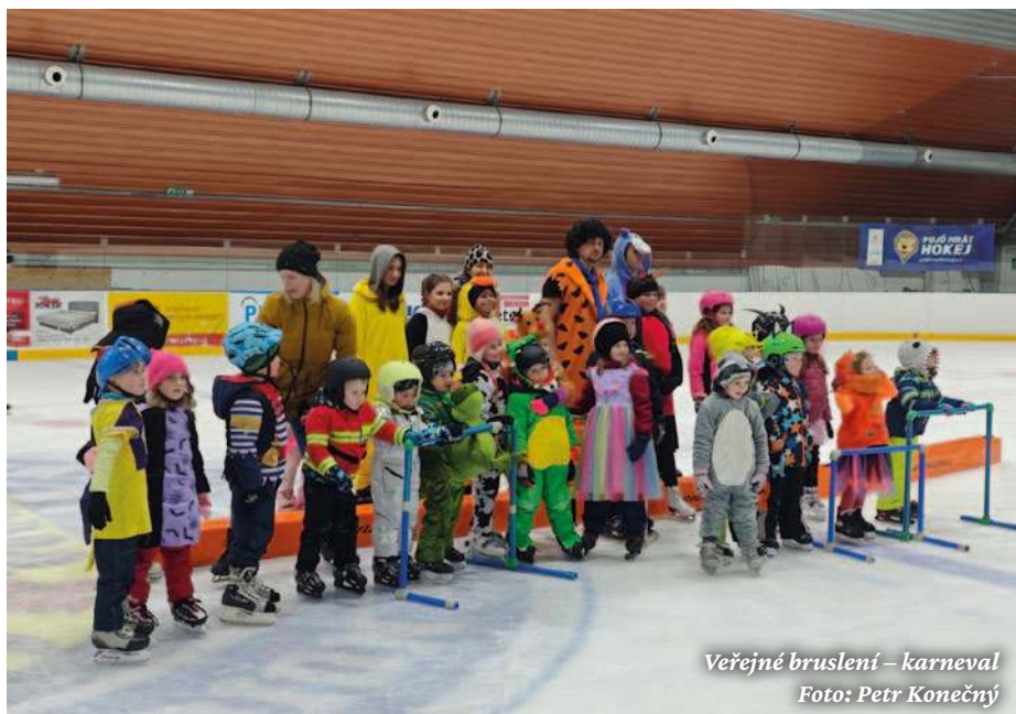
Veřejné bruslení – karneval