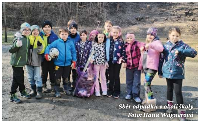
Sběr odpadků v okolí školy