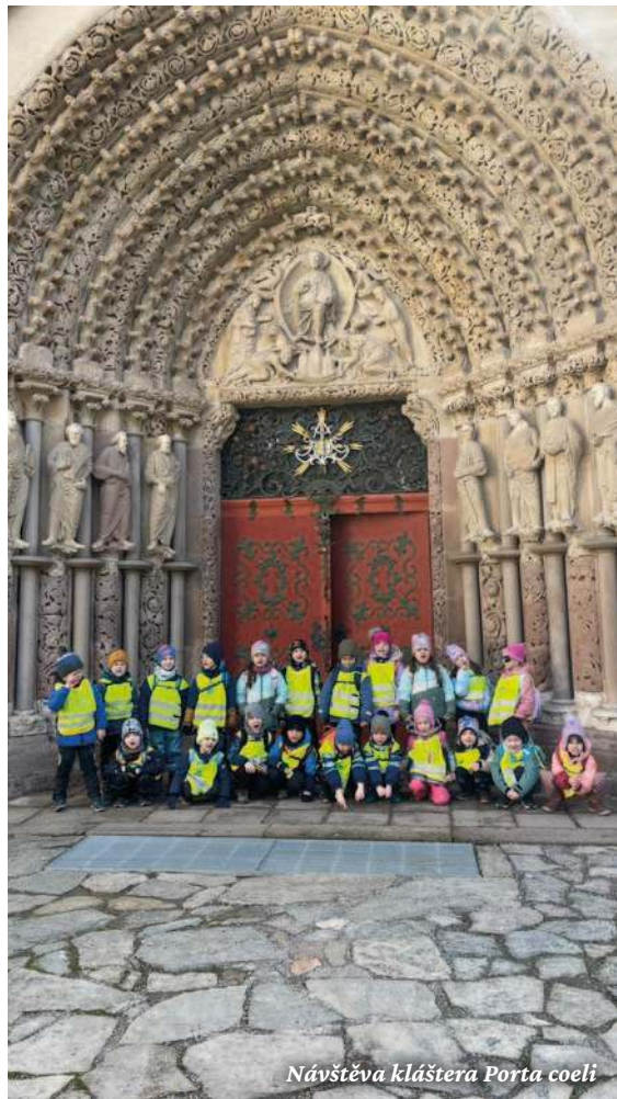
Návštěva kláštera Porta coeli