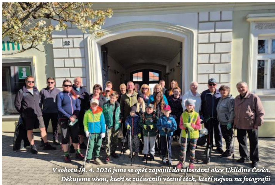
V sobotu 18. 4. 2026 jsme se opět zapojili do celostátní akce Uklidíme Česko. Děkujeme všem, kteří se zúčastnili včetně těch, kteří nejsou na fotografii