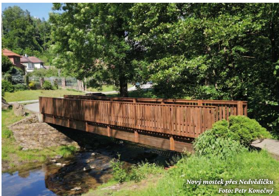
Nový mostek přes Nedvědičku