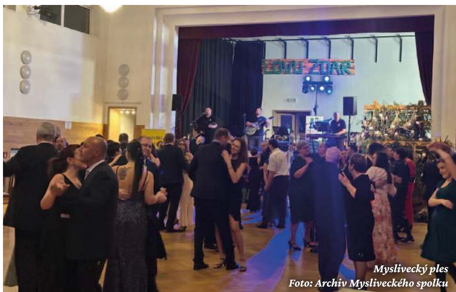
Myslivecký ples