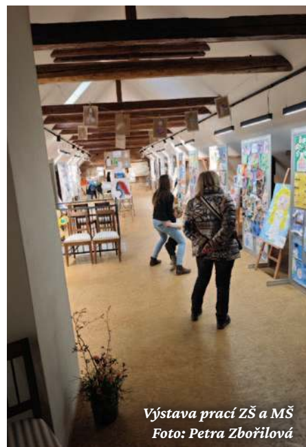
Výstava prací ZŠ a MŠ