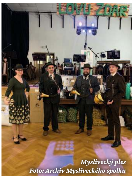
Myslivecký ples