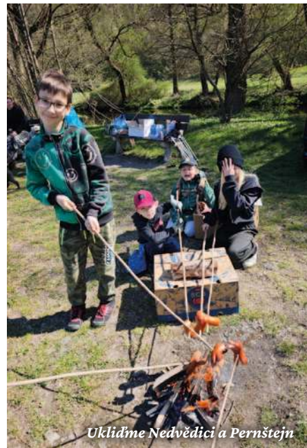
Uklidíme Nedvědice a Pernštejn