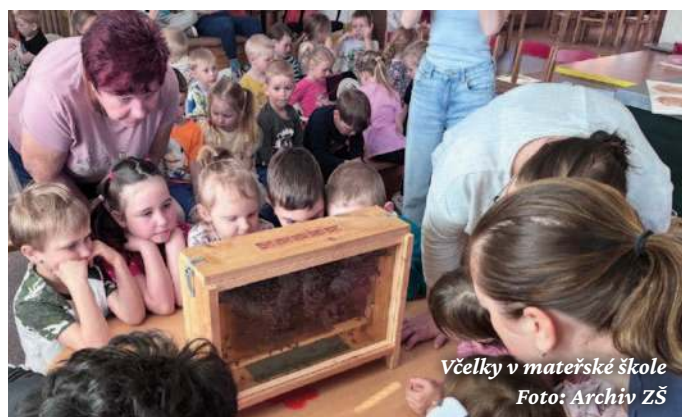
Včelky v mateřské škole