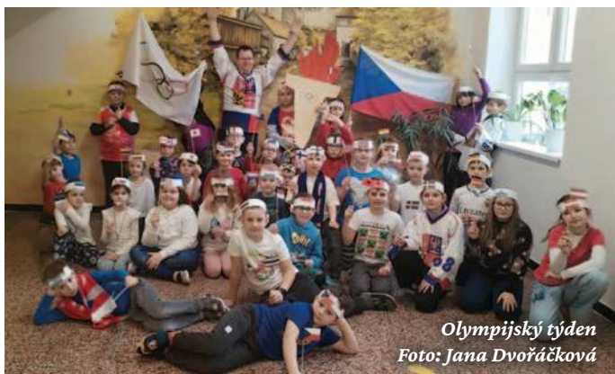
Olympijský týden