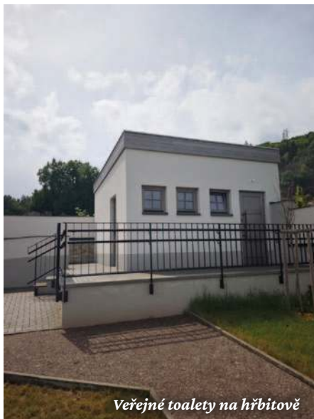
Veřejné toalety na hřbitově

Společně jsme mohli trávit čas na bruslích při tradičním veřejném bruslení na Zimním stadionu v Bystřici nad Pernštejnem. Zájemci si mohli otužit organismus při silvestrovském koupání v místním rybníku. Kdo naopak dával přednost rychlejšímu pohybu, měl možnost navštěvovat taneční lekce v místní sokolovně, které díky velkému zájmu pokračovaly již druhým rokem. V polovině