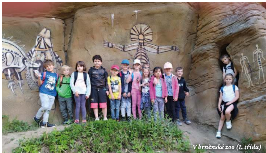
V brněnské zoo (1. třída)

Velké poděkování také patří Vaším rodičům, kteří Vás podporovali a pomáhali Vám společně zvládat všechny výzvy bě-