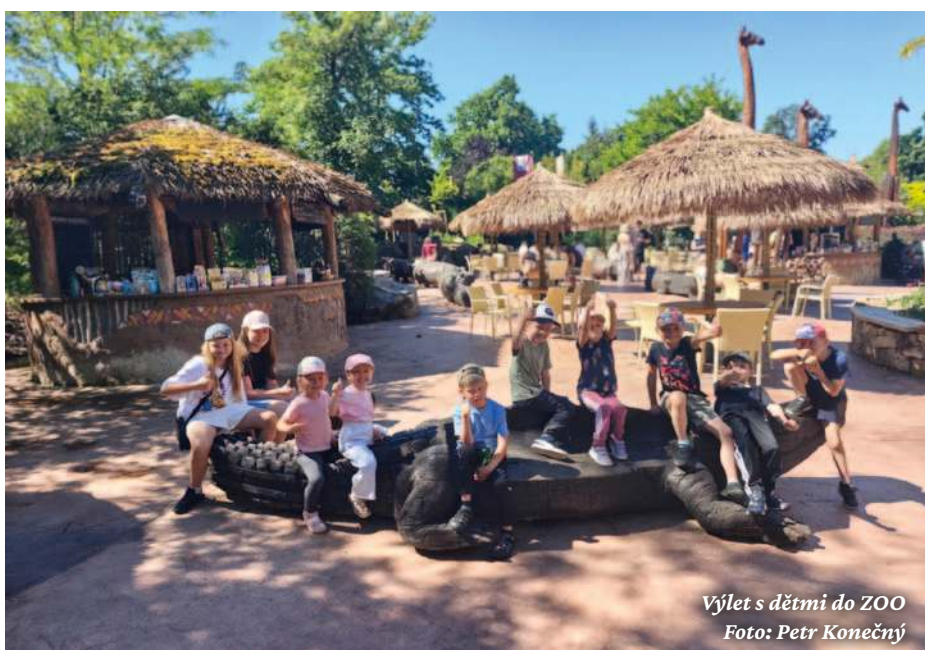
Výlet s dětmi do ZOO