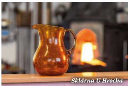
Sklárna U Hrocha