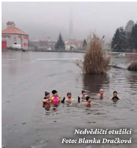
Nedvědičtí otužilci

Z aktuálních stavebních akcí uvedu významné rozšíření hracích prvků pro děti v lokalitě na Kovářově louce. Doplňili jsme dvě trampolíny, lezeckou stěnu a máme nainstalovanou novou dvojitou lanovku, na které se mohou svést i dospělí. V těsné blízkosti byla započata generální oprava všech čtyř mostků přes Nedvědičku. Při opravě dojde ke kompletnímu rozebrání konstrukcí. V nosných částech provádíme lokální opravy, nové prvky budou nahrazeny modřínovým dřevem, které je tlakově impregnováno. Vše děláme s jasným cílem, tedy prodloužení životnosti mostků. Naproti zdravotnímu středisku znovu obnovíme dřevěný vláček pro děti, který bude doplněn o nový foto-point. Finalizujeme s přípravou projektu zklidnění dopravy před školou, a to v podobě světelného signalizačního zařízení na přechodu pro chodce. Pokud vše stihneme administrativně v rozumné době, tak přistoupíme k celkové opravě cenného kovového mostu přes řeku Svratku v těsné blízkosti fotbalového hřiště. Do-