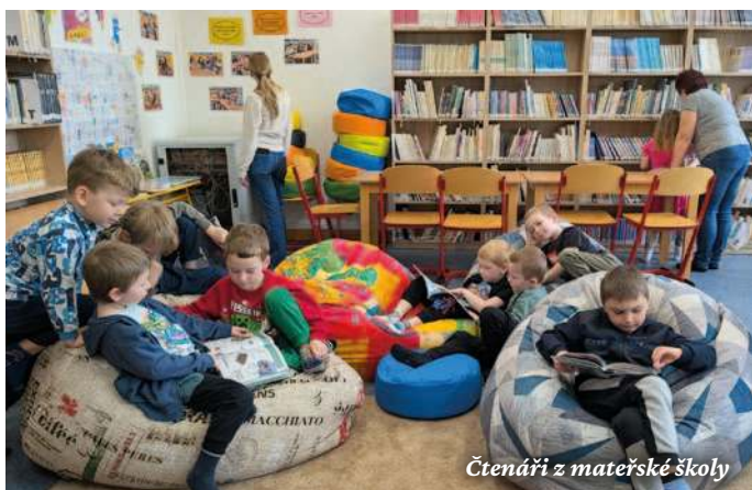
Čtenáři z mateřské školy