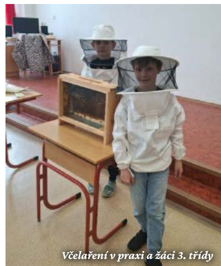
Včelaření v praxi a žáci 3. třídy