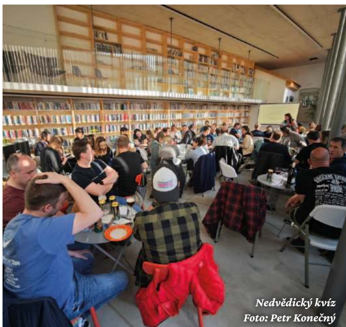
Nedvědícký kvíz