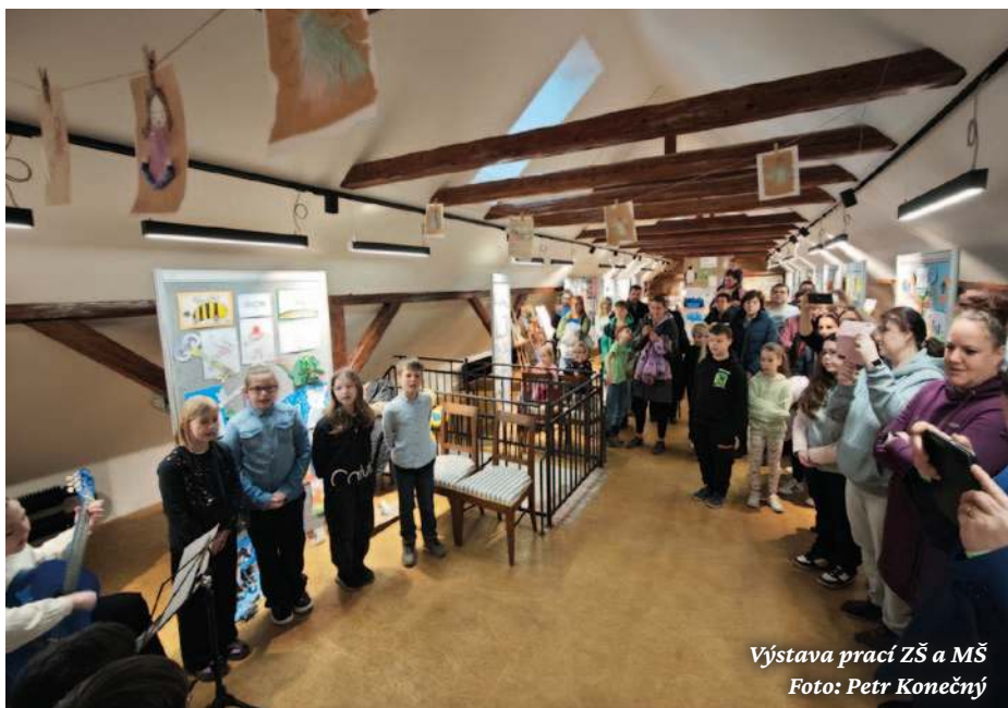
Výstava prací ZŠ a MŠ