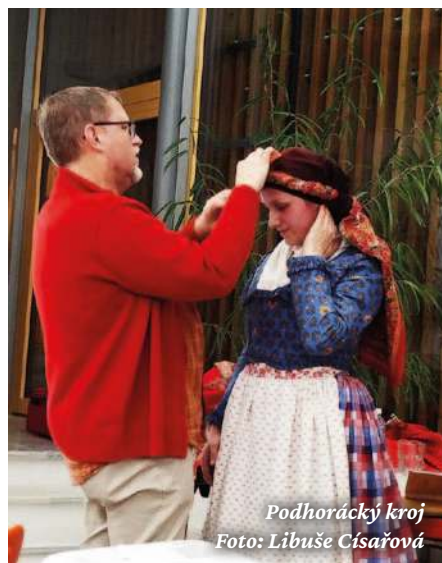
Podhorácký kroj