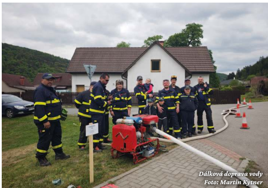
Dálková doprava vody