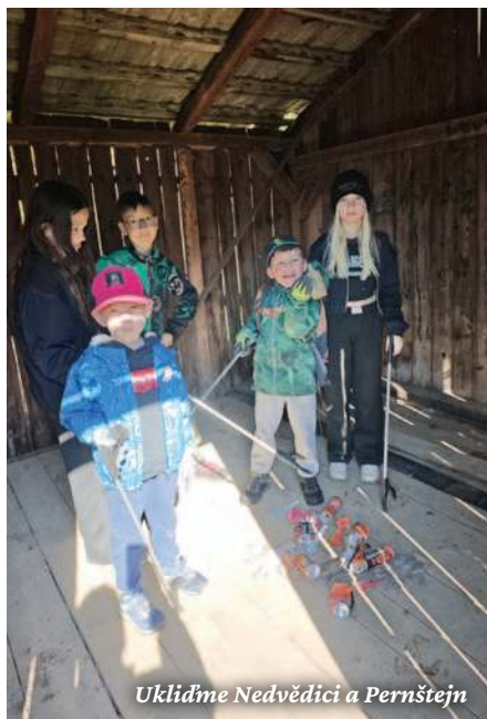
Uklidíme Nedvědice a Pernštejn