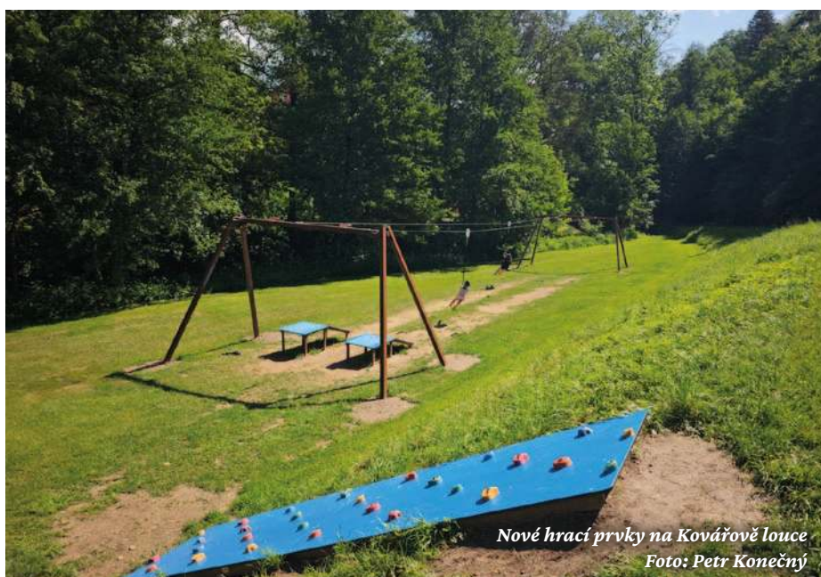
Nové hrací prvky na Kovářově louce