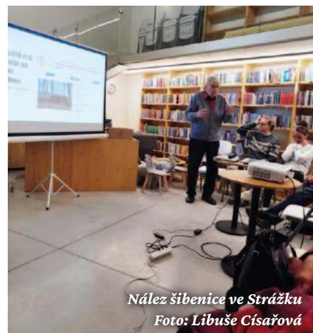
Nález šibenice ve Strážku