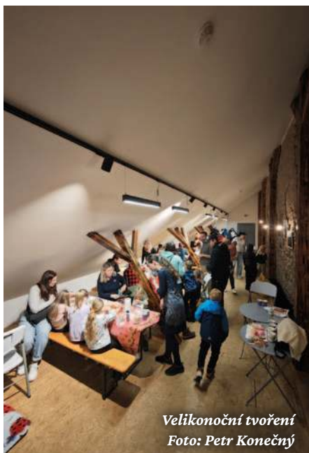
Velikonoční tvoření