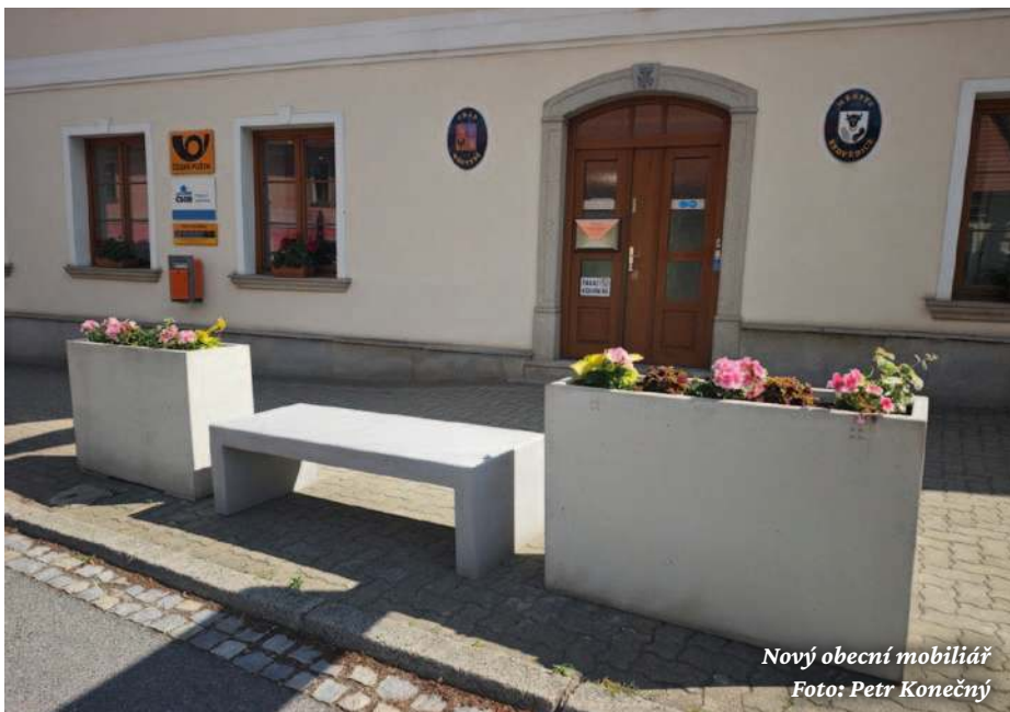
Nový obecní mobiliář