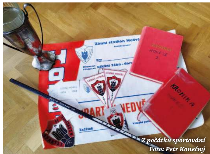
Z počátku sportování