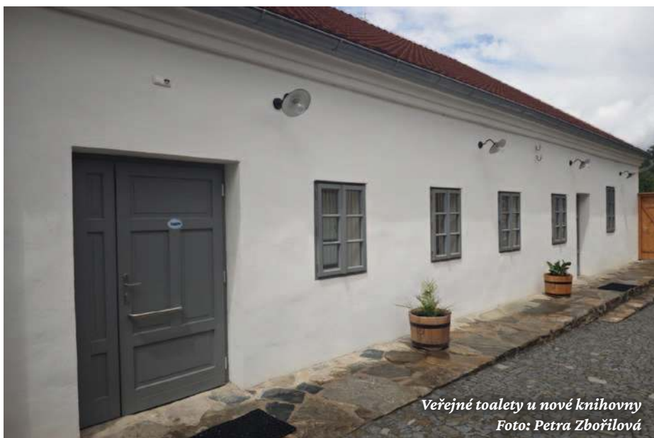
Veřejné toalety u nové knihovny

V sobotu 6. června vyrazily děti s rodiči na společný výlet do ZOO Lešná. Ti, kteří si zakoupili vstupenky na muzikál