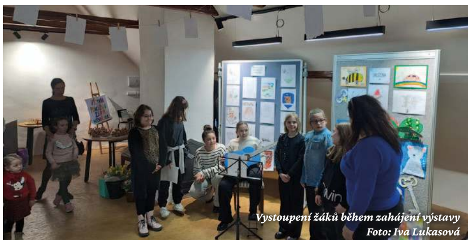
Vystoupení žáků během zahájení výstavy