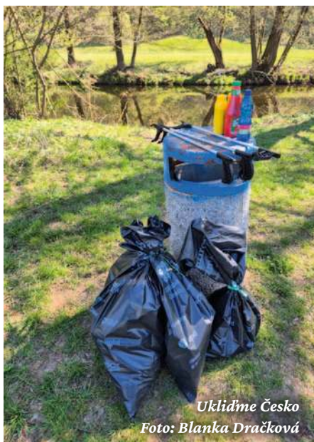
Uklidíme Česko