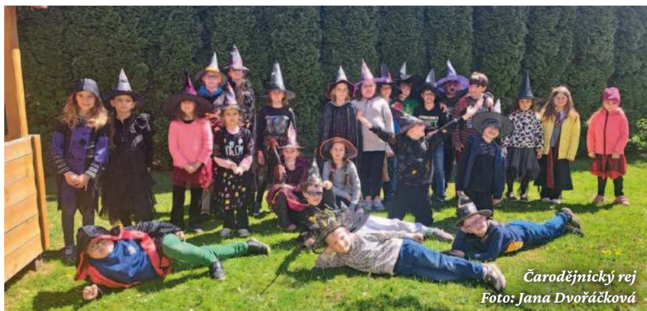
Čarodějnický rej

S příchodem jara jsme se zaměřili na ekologii. V rámci projektového týdne ke Dni Země jsme se učili správně třídit odpad a vyzkoušeli jsme si, že i z recyklovaných materiálů se dají vytvořit krásné a originální věci.