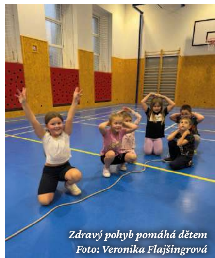
Zdravý pohyb pomáhá dětem