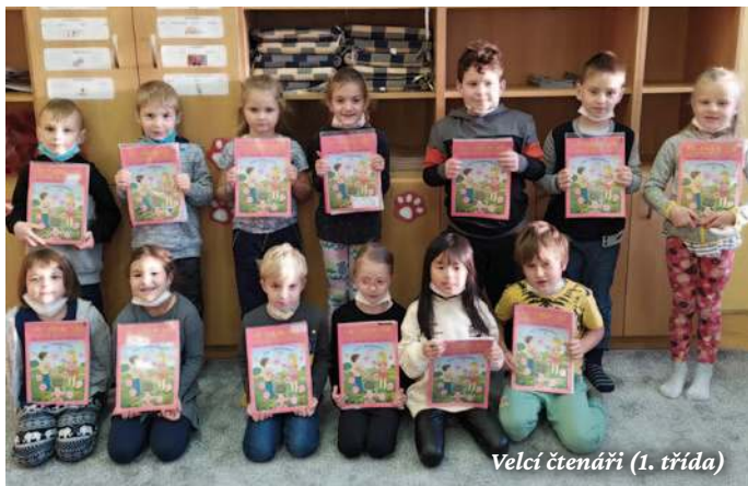
Velcí čtenáři (1. třída)