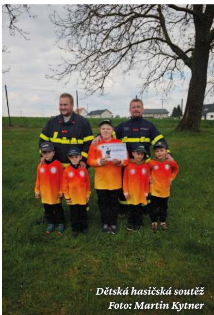
Dětská hasičská soutěž