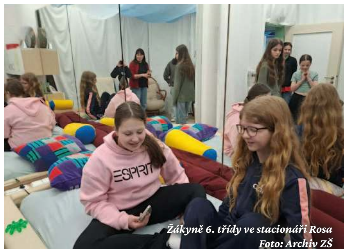
Žákyně 6. třídy ve stacionáři Rosa