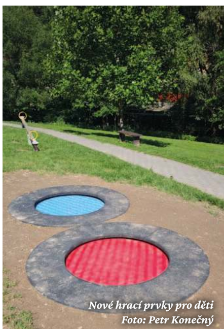
Nové hrací prvky pro děti