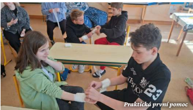
Praktická první pomoc