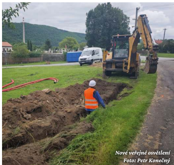
Nové veřejné osvětlení