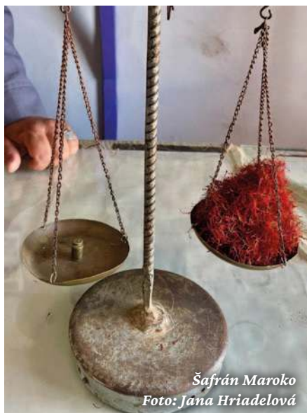
Šafrán Maroko

Nakonec něco málo i k ovocným pokladům u nás.