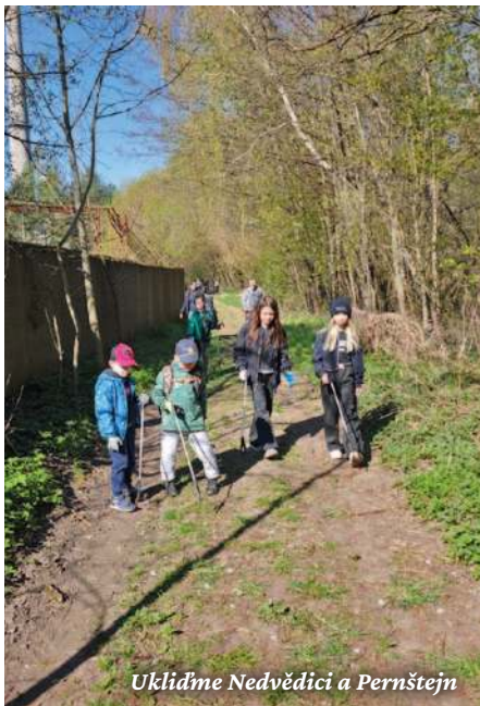
Uklidíme Nedvědice a Pernštejn