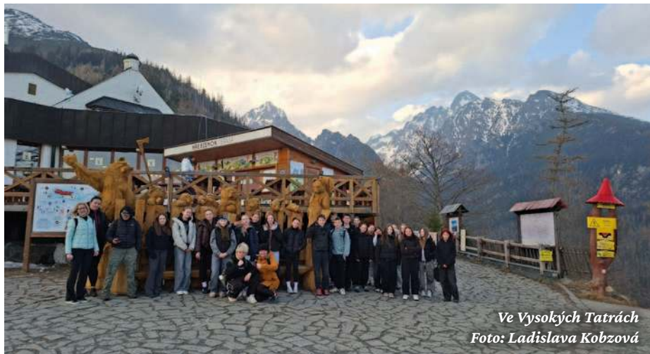
Ve Vysokých Tatrách

Projekt přinesl nejen nové poznatky a zkušenosti, ale především radost ze spo-