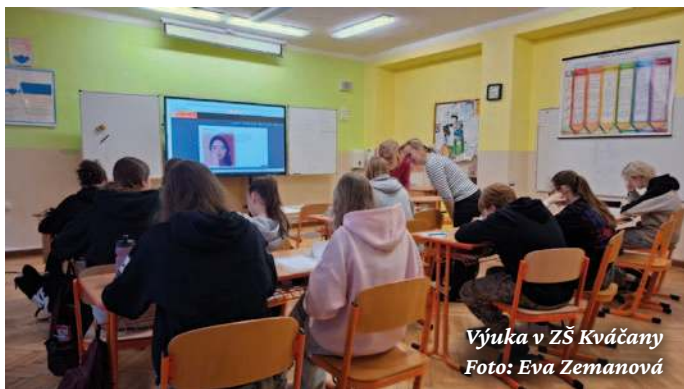
Výuka v ZŠ Kvačany