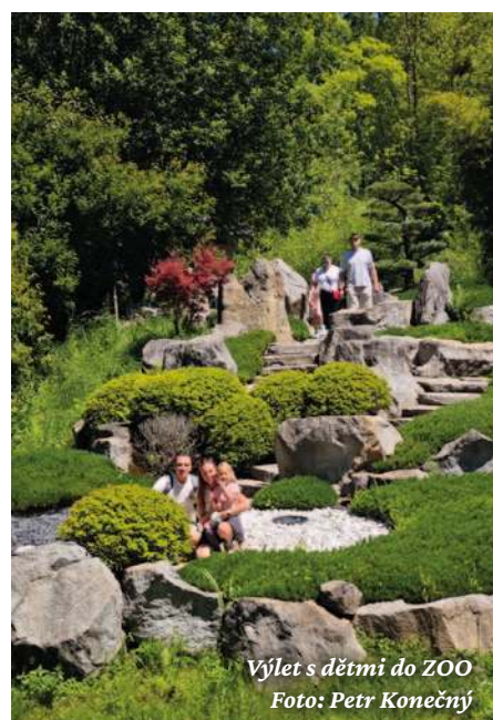
Výlet s dětmi do ZOO