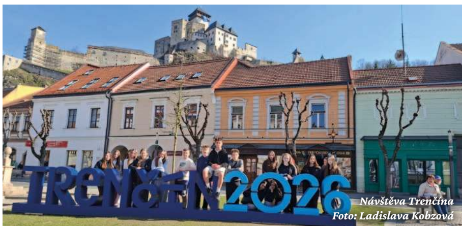
Návštěva Trenčína

Na učitelské stáži navázaly výměnné pobyty žáků. Jako první přijeli v únoru slovenští žáci do České republiky, kde je čekal pestrý program – ve školních lavi-