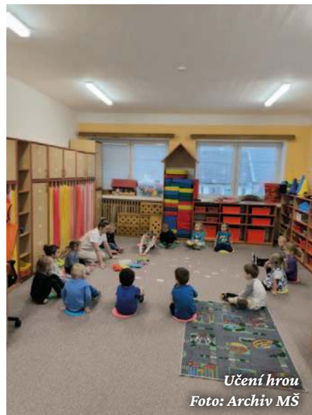
Učení hrou